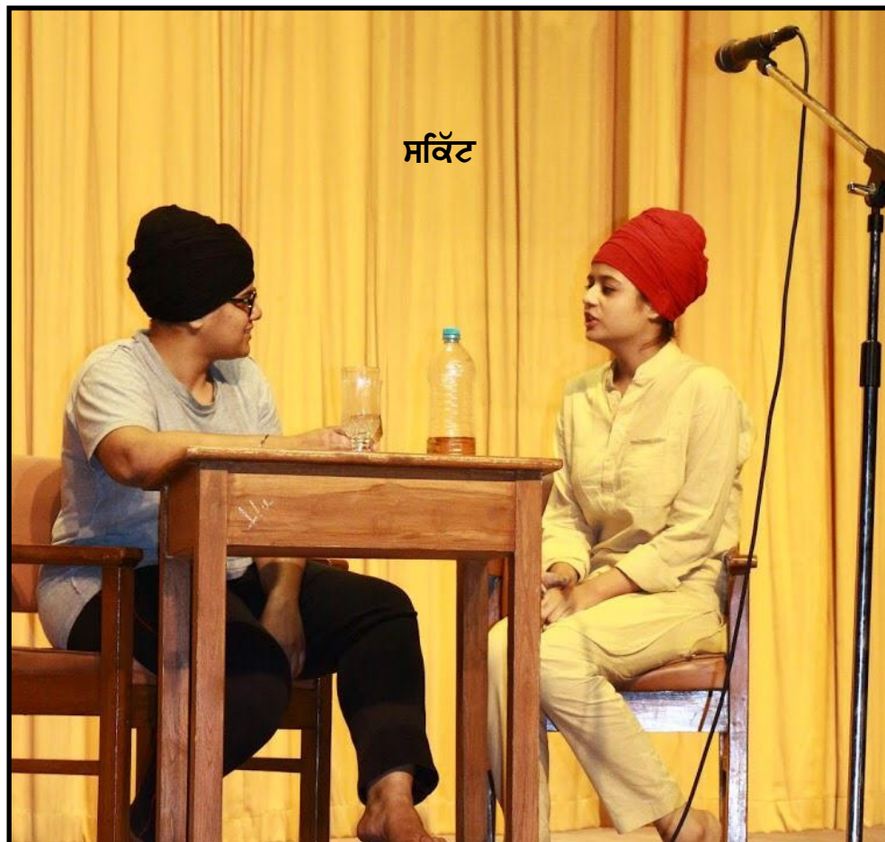
ਨਸ਼ਿਆਂ 'ਤੇ ਲਘੂ ਨਾਟਕ ਪੇਸ਼ ਕਰਦੇ ਬੀ.ਏ. ਦੂਜਾ ਪੰਜਾਬੀ ਆਨਰਜ਼ ਦੇ ਕਲਾਕਾਰ