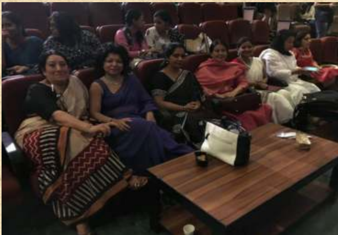
Beloved Teachers as Audience and Judges, the Political Science Meet 5 Sep 2016