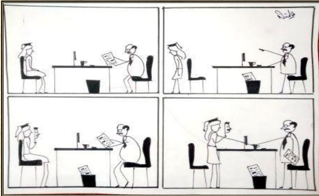
A Take on Gender Inequality at Workplaces