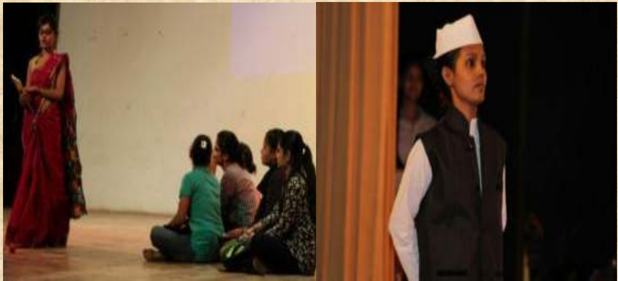
Glimpses of the Play 'Shiksha ka Circus', Political Science Meet, Sep 5 2015