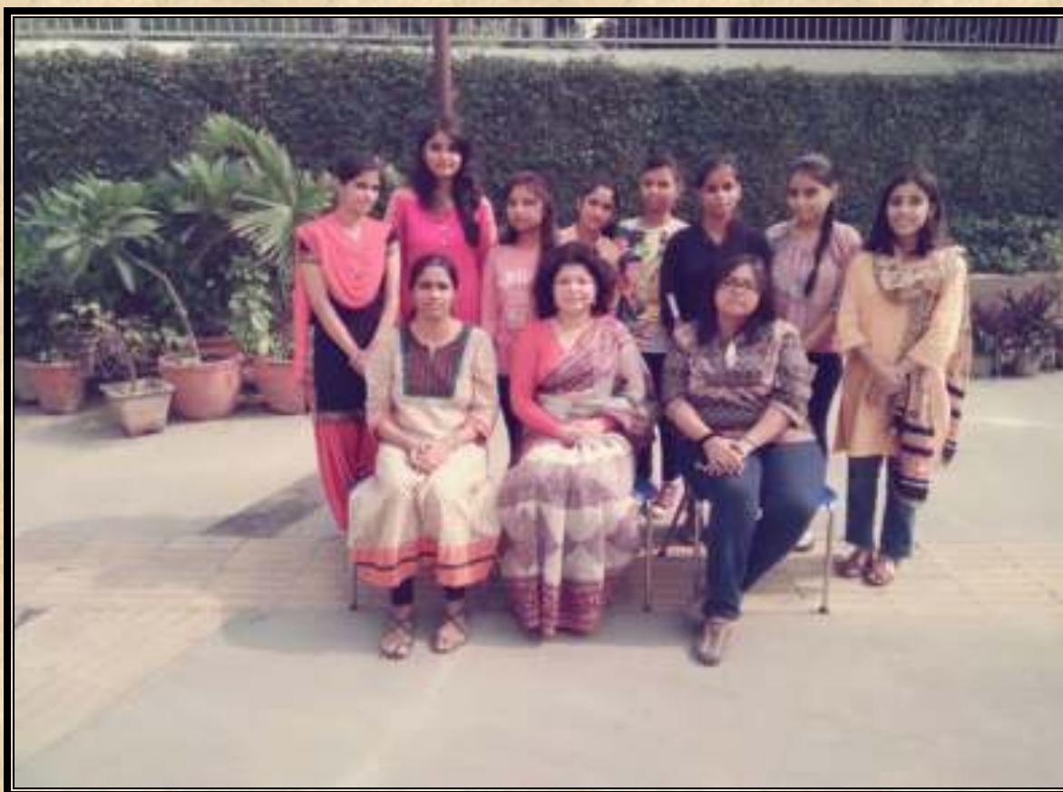
The Editorial Team