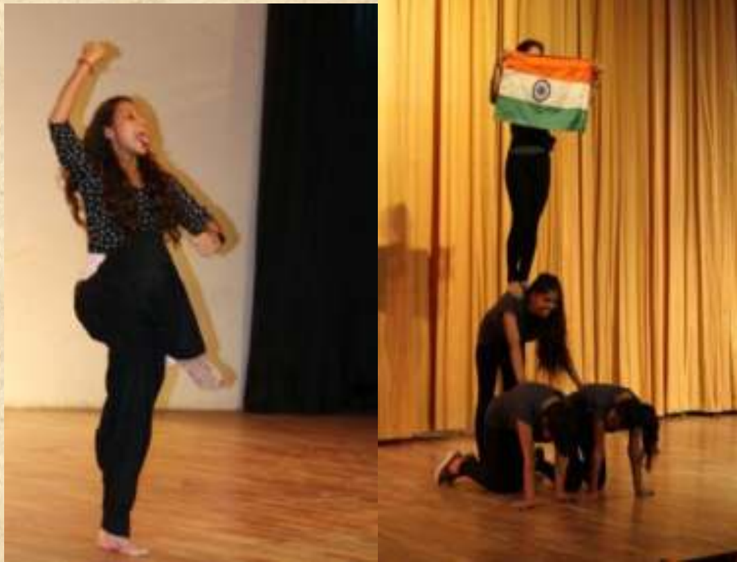
Different Hues of the Political Science Meet, Sep 5 2016