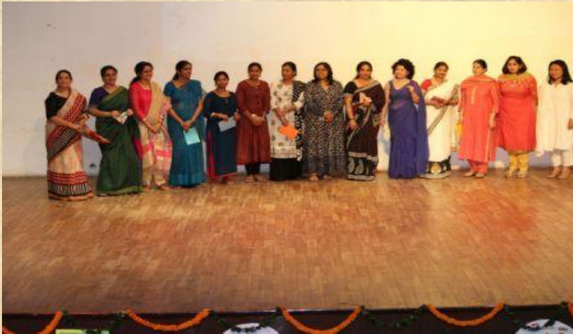
Celebrating Teachers Day at Political Science Meet, 5 Sep, 2016