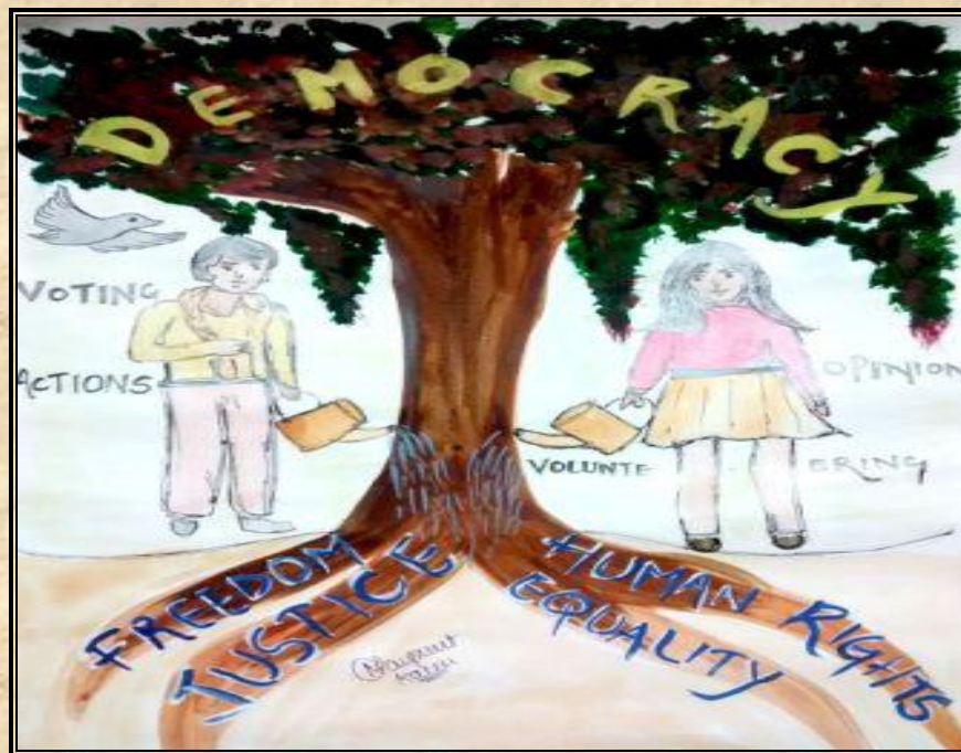
Roots of Democracy